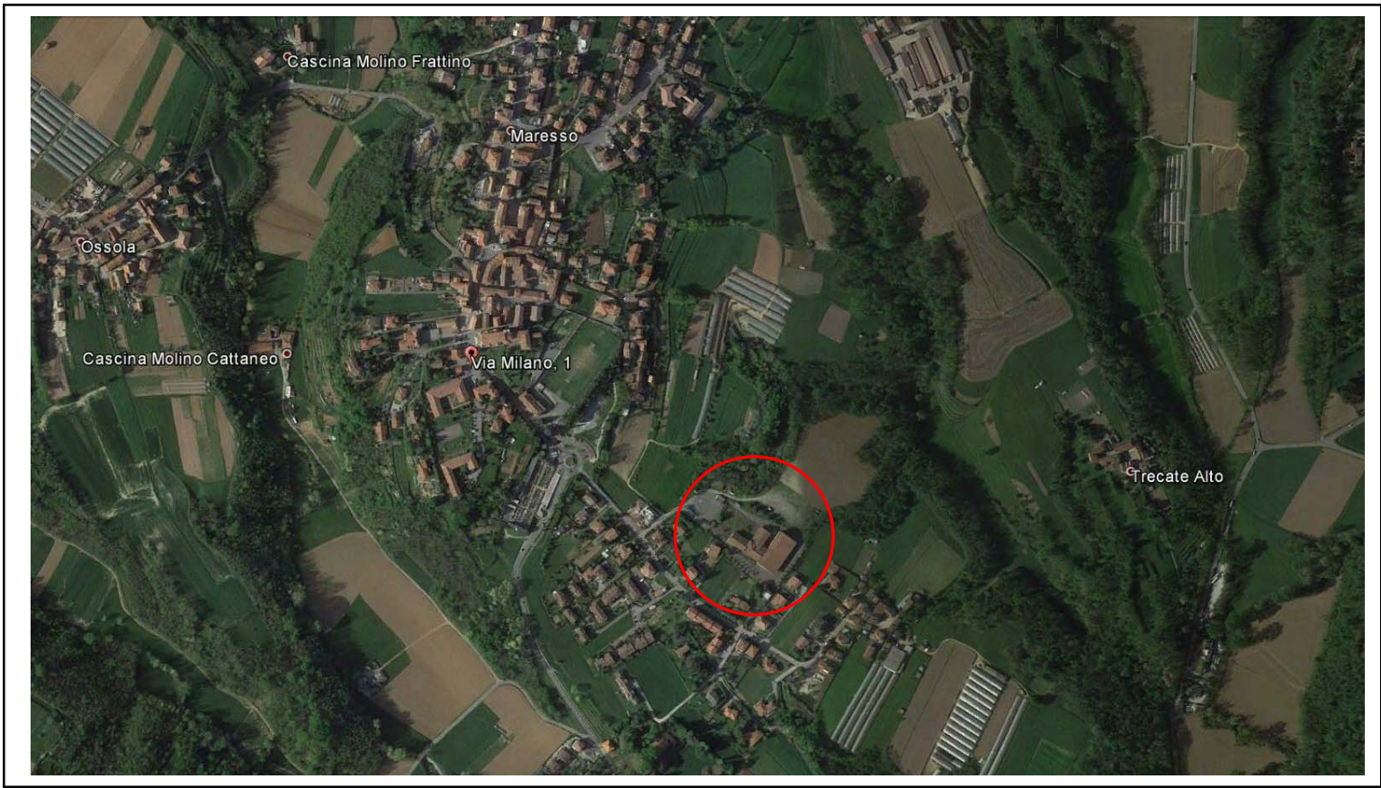
Estratto Ortofoto Satellitare